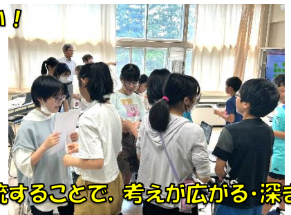
交流することで、考えが広がる・深まる