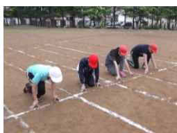
クラウチングスタートの練習!

また、四年生以上の子どもたちは各係(用具、審判等)に分かれて、それぞれの仕事を担当します。のぞみ学級の四年生以上の五人も張り切っています。見所満載となっておりますので、時間がありません。ぜひお越しください。