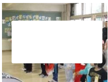
結団式 赤・白それぞれの結束を高めました

当日は青空の下、元気いっぱい練習の成果を表現したいと思います。ご声援よろしくお願いします。