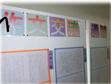
作文交流週間の取組 運動会をテーマにした全校の作文交流で書くことのスキルを高める