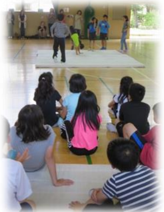
4年 体育「マット運動」 グループで組み合わせ技の発表

先週は月曜日から金曜日まで 30 度以下だった日が 11 日 (火) の 1 日のみ、10 日 (月) 33.4 度、12 日 (水) 32.5 度、13 日 (木) 35.3 度、14 日 (金) 36.2 度と本当に記録的な暑さとなりました。本校の暑さ対策としては、窓を開けて換気、水分補給 (水筒の持参は 11 日 (火) から)、ミストシャワーの使用、さらに、今週から扇風機を各学級に用意しました。(とたんに暑さが小休止しましたが) そんな中でも子どもたちや先生方は汗を流しながら日々の学習や教育活動に頑張ってきました。目前に迫った 1 学期の終業式とすぐに始まる夏季休業へ思いをはせながら、まとめとふりかえりに大詰めの日々です。