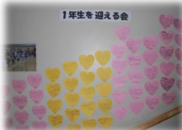
心のふりかえりカード（道徳教育） 子どもたちや保護者の方の行事への感想や思いが書かれています