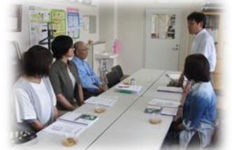
学校長より経営方針とこれまでの経過について説明

本校の学校評議員は地域関係者5名で構成されています。法令にもとづいて学校の運営に関わる地域住民の意見聴取・協力依頼と説明責任を果たすことを目的としています。7日（金）は参観日でもあり、説明よりも百聞は一見にしかず、で、左の写真にあるように2・5・6年の授業を参観していただきました。折しも35℃の猛暑日でしたが子ども達や先生方の熱心な取組に安心して帰られました。