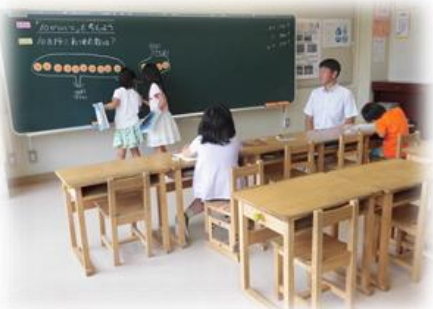
2年 算数「100 より大きい数」 3 教室での少人数指導