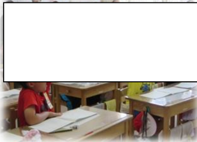
1年 算数「のこりはいくつ」 暑くても元気に発表