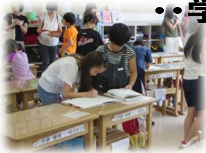
3年 算数「あまりのあるわり算」 解き方を友だちと交流