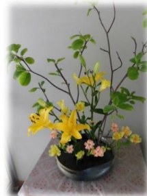
玄関の生け花 潤いに感謝！

伝えきれないほどの教育活動が目まぐるしく展開されています。すべて子どもたちに力をつけるための活動です！2学期はもっとくわしくわかりやすく伝えていきたいと思っています！ ★なお、ホームページではスピーチにお伝えしています！