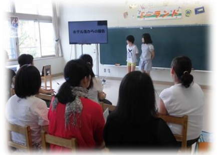
6年 総合的な学習の時間 修学旅行 (6 月) のまとめのプレゼン