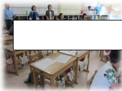
2年生 少人数指導の算数の授業を参観される評議員のみなさん

本校の学校評議員は地域関係者5名で構成されています。法令にもとづいて学校の運営に関わる地域住民の意見聴取・協力依頼と説明責任を果たすことを目的としています。7日（金）は参観日でもあり、説明よりも百聞は一見にしかず、で、左の写真にあるように2・5・6年の授業を参観していただきました。折しも35℃の猛暑日でしたが子ども達や先生方の熱心な取組に安心して帰られました。