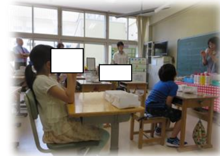
のぞみ学級 1・2 組合同 図工 先生のお話をしっかり聞いて作る