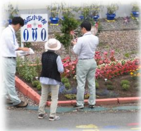
花壇審査の様子 十九日

写真は12日（水）の20分休みの花壇の風景です。子ども花壇ボランティアの子どもたちと花壇ボランティアのみなさんとの花壇整備の様子です。短い時間でしたが、20名ほどの子ども達が、花壇やその周辺の草取りを頑張りました。現在花壇には、子どもたちがペットボトルから制作したカラフルな風車も涼しい風に回っています。毎年花壇ボランティアのみなさんが中心になってデザインし、苗を移植、そして、お世話をしてくださっている本校の大きな3つの花壇は、今現在、色とりどりの花と風車で彩られています。来校する人たちの目を楽しませてくれています。