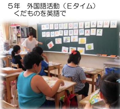
5年 外国語活動 (E タイム) くだものを英語で