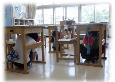
ショート避難訓練（地震） 素早く机の下に隠れるのぞみ2組 の子どもたち 4日（火）