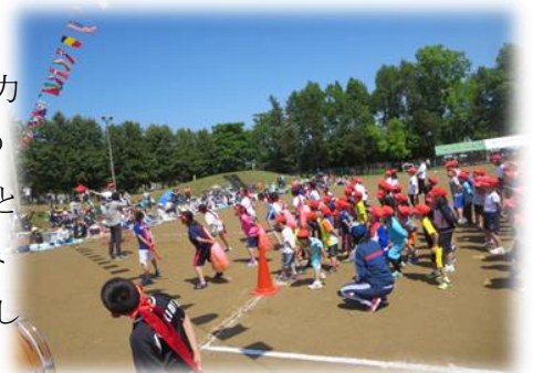
6月 第121回 運動会

また、時間をかけて取り組めることへのチャレンジや「継続」を力にする教科の復習などもおろそかにせず、「知・徳・体」バランスのとれたそれぞれのご家庭の特色を生かした有意義な夏休みになることを期待いたします。8月18日(金)の第2学期始業式には、夏休み期間中に事故に遭う事もなく、病気や怪我もなく、たくましく成長した子どもたちの元気な姿を見るのを楽しみにしています。