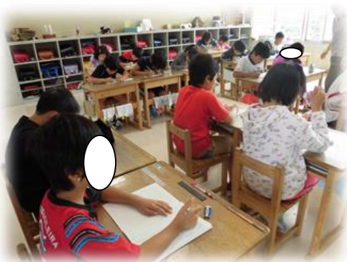
21日(月)朝 4年生 漢字の学習中

仕切り直しの新たな一週間が始まりましたが、二十一日(月)は連休をはさんでしまったのでどうか、と思っっていました。しかし、一年生から六年生まで各教室で先生方の指導支援の元で学習に気持ちを切り替えて落ち着いて取り組んでいます。一学期からの積み上げで作上げた学校の朝のリズムがしっかりと維持されていることに感心させられました。先生のいない場所でも、友達と声をかけあってそれぞれが考えて行動できるようにすれば、本物の成長といえます。三つの言葉の内の「行動 きびきび」(言われる前に自分から)が実践できたことになりました。 一方で一学期から友人関係や学校生活に悩みを抱えていたり、長期休業で生活リズムや学習への取組が自分本位になっていたりと学校へ足が向きにくくなったりして、不登校や怠学の原因になることはめずらしいことではありません。学校でも十分に留意していきたいと思っておりますが、ご家庭でもお子さんの生活リズムにご配慮ください。心配なことや気になることは担任にご相談ください。