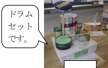
ドラムセットです。