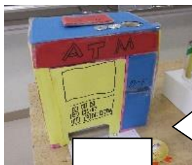
右の作品はB B Q(箱の中は炭ですよ)、左はATMです。とてもリアル!