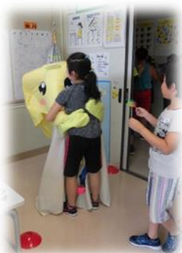
キャラクターとハグ 七日(木)