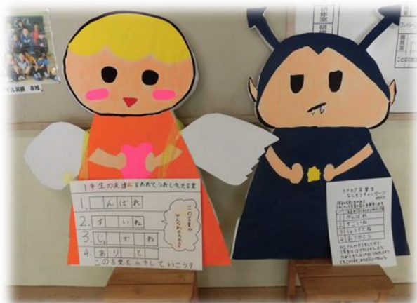
児童玄関ホールに飾られたキャンペーンキャラクター フワ(左)とチク(右) 言葉は相手の心の栄養になったり、心を傷つけたりもします。

帯広市では、長期休業明けが特に配慮が必要ということで、8月下旬～9月上旬を「いじめ防止強化月間」と取り立てて位置付けていました。いじめの防止は、本来時期に関係なく、私たち教育関係者は常に意識しておかなければならないことです。私も「いじめ・いじ悪、絶対ダメ」と集会の毎に子どもたちに直接話しています。