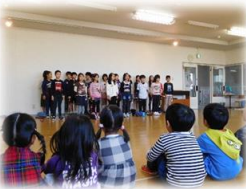
3年1組 どんぐり保育所