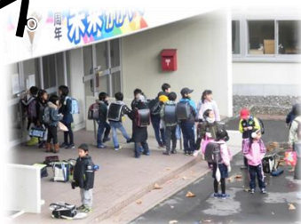
開錠前の児童玄関前 こんな感じです 30日(月)