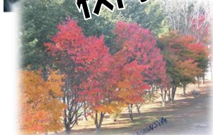
グラウンド横 紅葉のもみじ 25日(水)