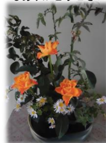
玄関の生け花 30日(月) いつもありがとうございます