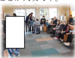
2年 愛の家グループホーム