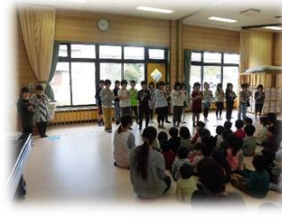
3年2組 きたのくにこども園