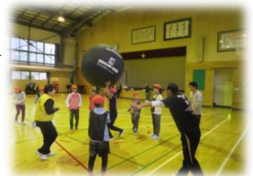
キンボールスポーツを5年生が 保護者と体験 23日(月)