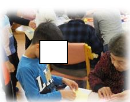
1年 シルバーヒルズくるくる

道徳教育との関連から各学級が、地域の保育園・ケアセンターなどに出かけ、園児やお年寄りと交流を行い、道徳的心情や実践力・意欲を高める活動に取り組みました。違いを認めたり、弱者を思いやったり、頭でわかっている行動に示せることが大切です。