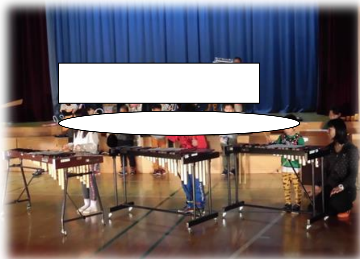
真剣に練習にのぞむ1年生 2日(木)

特別時間割は先月二十日(金)から、本格的な取組が始まって三週間です。途中、連休や休日をはさまっていますので、決して長いとは言えない限られた時間の中で、担任外職員も協働しながら、準備や練習を重ねてきました。子どもたち一人一人や児童会もそれぞれ具体的な目標をもち、受け身ではなくやる気をもって頑張ってきました。 明日はいよいよ、その成果を発表する日です。多くの保護者や地域の方々が来校され、観覧していただけるものと確信しておりますが、盛大な拍手を子どもたちにお送りください。何にも代え難いのは、大きな拍手と、帰ってからのうちの励みになる一言です。よろしくお願いいたします。