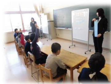
←こもれば学級(1・2年) ステップタイム 集中して学習できていました。20日(月)