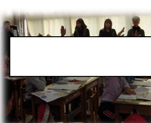
道徳の時間 3年 29日(水)