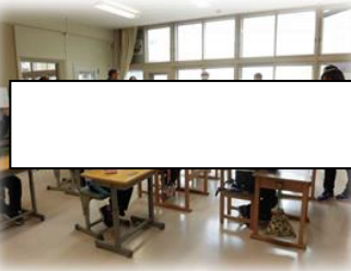
↑のぞみ学級(生活単元学習) 質問の答えや自分の考えをホワイトボードを使って学習 29日(水)