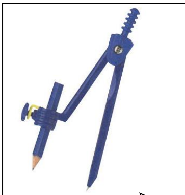
鉛筆タイプのコンパス

分度器・・・「袴」のついたもの。直径9cmのものが、教科書の説明とぴったり合い、お勧めです。