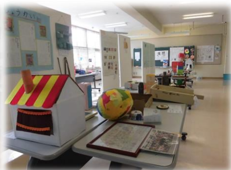
2階 ふれあいルーム 1・2・3年生の作品