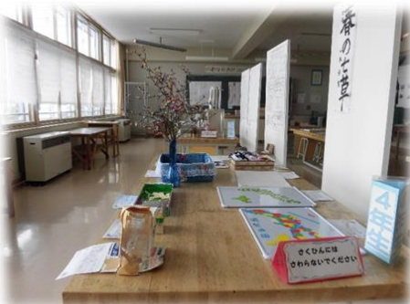
3階 図工室 4~6年生・のぞみ学級の作品

紙面の関係で写真は後になってしまいますが、この間、1・2年生の冬道交通教室、のぞみ学級の太谷短大生との交流、CRT学力テストがありました。学校が動き出し、少しずつ子どもたちもそのリズムに乗り始めています。