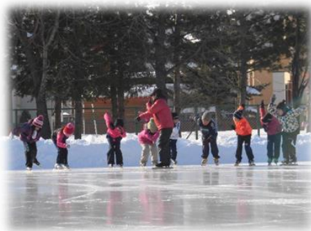
左：冬休みスケート教室 4名のエキスパートから手ほどきをうける1~3年生 1月16日(火)・17日(水) 右：冬休み学習DAY 学び直しに取り組む参加した児童 1月19日(金)