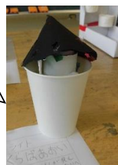
星のライト(きれいだよ)