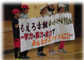
テーマを発表する児童会事務局

五日(水)の総練習延期への対応に感謝いたします。降ったり止んだりでしたが、乾燥していたグラウンドにちよつと多めのお湿りとなりました。過日別紙でもお知らせしたとおり、運動会当日の日程に変更があるときは、帯広市子供安全ネットワーク本校メールでお知らせしますので登録について再度ご確認ください。さて、すでにホームページでは紹介されましたが、左の写真は五月三十一日(金)に行われた全校朝会の一コマです。赤白応援合戦の内容をお互いに紹介し合い気持ちを盛り上げました。赤白応援団ならではの元気と気合いの中にユーモアもはさみながらの楽しい発表となっております。当日は他の競技とともにい発表とさせていただきます。暑い日もあった二週間という短期集中型の練習期間が過ぎ、運動会当日がいよいよ迫りましました。今日は4年生以上の子どもたちが会場準備を手伝いました。子どもたちの気持ちも高まります。声援・拍手をよろしく願います。