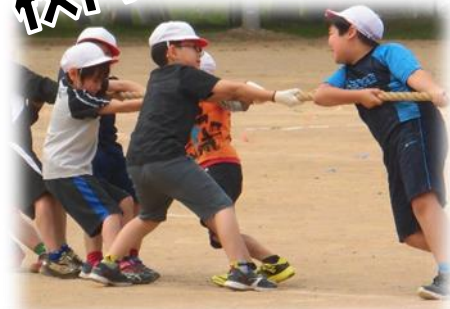
練習でも力が入る 綱引き 3~6年生