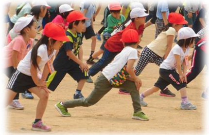
覚えたね。ストレッチ体操 1年生