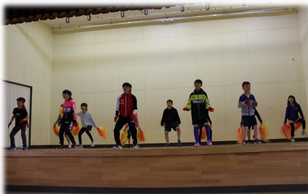
応援を発表し合う赤・白両組の応援団とチア アングルの関係で写っていない子もいるかもしれません。ステージ下左右 両側には応援旗・太鼓担当の2人がおります。応援団・チアは担当の先生 の指導の下、6年生のリードで連日一生懸命に練習に励んできました。