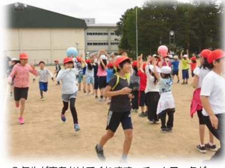
6年生が声をかけてくれます。チームワークがいいのは果たして? 選手リレーに替わるたてわり新種目 大玉おくり 1・2・3!