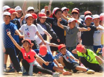
決めポーズの確認 帯小ソーラン