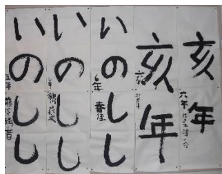
4, 5, 6年生の作品

二十五日間の冬休みが終わり、三学期が始まっています。今年も厳しい寒さが続いています。例年と違って雪がとてもなく、スケートリンクの造成が大幅に遅れました。帯広小学校のリンクは、今週ようやくオープンすることができました。さて、三学期の授業日数は四十三日間。卒業式・修了式に向けて、まとめの学習をがんばっていきます。